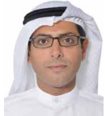
السادة المساهمين الكرام،

ويسعدني أن أعلن لكم عن تحقيق الشركة صافي أرباح بلغت 1,398,419 دينار كويتي (مليون وثلاثمائة وثمانية وتسعون ألف وأربعمائة وتسعة عشر دينار كويتي) للسنة المالية المنتهية في 30 سبتمبر 2018 وذلك بعد استقطاع مخصصات الزكاة ومؤسسة الكويت للتقدم العلمي، وذلك بزيادة بلغت قدرها 51,788 دينار كويتي (واحد وخمسون ألف وسبعمائة وثمانية وسبعون دينار كويتي) عن السنة المالية المنتهية